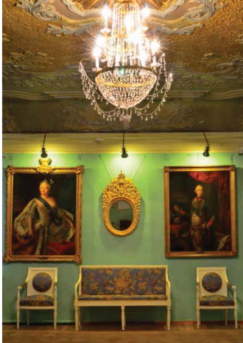
Интерьер экспозиции «Ризница Троице-Сергиевой лавы XIV–XIX веков»

95-летие отметил в нынешнем году Сергиево-Посадский государственный историко-художественный музей-заповедник. Музей в подмосковном Загорске основан декретом Совета народных комиссаров в 1920 году. На момент создания его коллекция составляла 10 тысяч единиц хранения. В основном это были художественные и исторические ценности Троице-Сергиевой лавры.