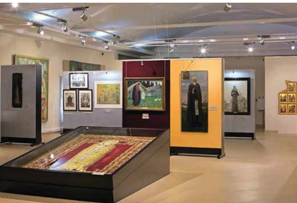
← Выставка «И свеча не угасла...»

В настоящий момент коллекции музея располагаются в четырёх комплексах в историческом центре Сергиева Посада. Это здание XVIII века на территории Троице-Сергиевой лавры (экспозиция «Ризница XIV–XIX веков»), историко-архитектурный комплекс «Конный двор» (где расположены экспозиции по археологии и этнографии), краеведческий корпус (выставки, посвящённые XX веку) и главный корпус Историко-художественного музея-заповедника, где регулярно выставляются работы ведущих художников Подмосковья.